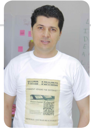
Par WISSEM OUESLATI EXPERT IT & E-COMMERCE